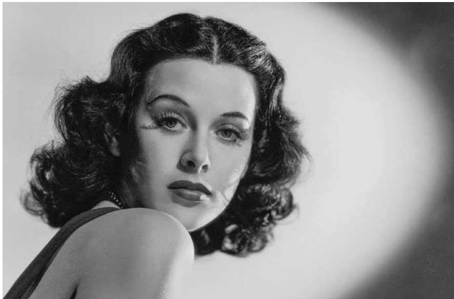
Stylish inventor: Hedy Lamarr

“It ain’t what you do, it’s the way that you do it. And that’s what gets results,” sang pop group Fun Boy Three. That is certainly the case with delegating.