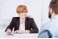
die Bankkauffrau banka memuru [ˈbɑŋka mɛ:muru]