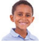
das Kind çocuk [tʃə'dʒuk]