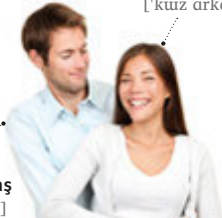
der Freund (erkek) arkadaş [er'kek arkadaş]