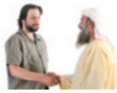
sich die Hand geben el sıkışmak [el sıkı'smak]