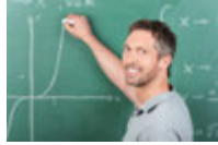
der Lehrer öğretmen [œ:ret'men]