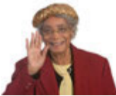
winken el sallamak [el sal:amak]