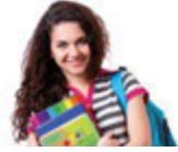
die Jugendliche genç kız ['gentʃ kuz]