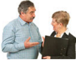
der/die Bekannte tanıdık [tanu'dʊk]