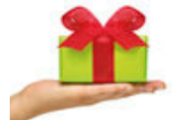
das kleine Geschenk küçük hediye [ky'tjyk hedi'je]