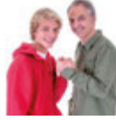
jemanden begrüßen birine selam vermek [biri'ne se'la:m vermek]