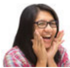
lachen gülmek [gyl'mek]