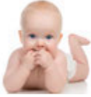
das Baby bebek [be'bek]