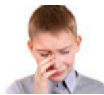
weinen ağlamak [a:l'a'mak]