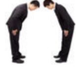
sich verbeugen eğilerek selam vermek [ei'l'erek se'la:m vermek]