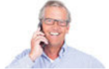
jemanden anrufen birine telefon etmek [biri'ne tele'fon etmek]