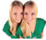
die Zwillinge ikizler [ikiz'ler]