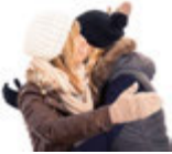
sich umarmen kucaklamak [ku'çakla'mak]