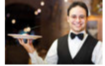
der Kellner garson [gar'son]