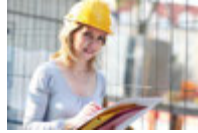
die Ingenieurin mühendis [myhen'dis]