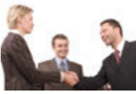
jemanden vorstellen birini tanıştırmak [biri'ni tanu'stur'mak]