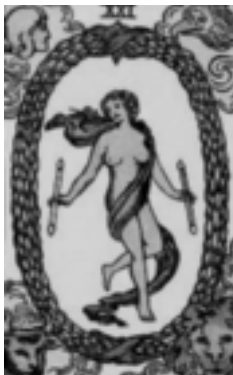
»Die Welt« aus dem Waite-Tarot

Mit großem Abstand am verbreitetsten ist das Waite-Smith-Tarot , auch als Rider-, Waite- oder RWS-Tarot bekannt. Es wurde von Arthur E. Waite und Pamela Colman Smith 1909 geschaffen und erschien im Londoner Verlag Rider.