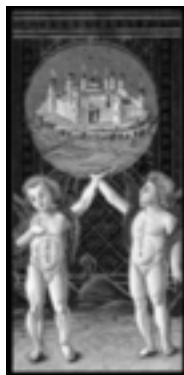
»Die Welt« aus dem Visconti-Tarot, dem ältesten Tarot

Die ersten Tarot-Karten entstanden in der Renaissance-Zeit. Etwa zwischen 1430 und 1460 wurden sie u. a. in Mailand und Bologna für große Fürstenhäuser gemalt. Die Renaissance-Zeit war ein »Schmelztiegel«, die Menschen wollten »raus aus dem finsternen Mittelalter«, sie suchten nach neuen Wegen, für die sie unzählige antike Traditionen wiederbelebten und neu entdeckten. Dieser »Zeitgeist« der Renaissance spiegelt sich in der Motivwahl des Tarot wieder. Die 78 Karten versammeln eine Fülle