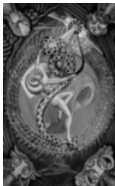
»Das Universum« aus dem Crowley-Tarot

Das Crowley-Harris-Tarot zeichnet sich durch seine energiegeladene Darstellungsweise aus und besitzt im Übrigen eine allegorische, d. h. sinnbildhafte Symbolik, die in sich lebt und zu einer persönlichen Betrachtungsweise auffordert. Einen wesentlichen Anteil an der Gestaltung der Karten trug Lady Frieda Harris, was mitunter übersehen wird. Aleister Crowley selbst gilt nicht ohne Grund als »Schwarzmagier«. Das ruft manchmal Berührungsgängste gegenüber den Crowley-Harris-Karten hervor. Doch nicht nur bei ihm, bei vielen bekannten Künstlern sind wir es gewohnt, einen Unterschied zwischen Leben und Werk zu machen. Es existiert kein zwingender Grund, von den Crowley-Harris-Karten Abstand zu nehmen. Sie stellen im Gegenteil eine bedeutende und vielsagende Bereicherung des Tarot dar.