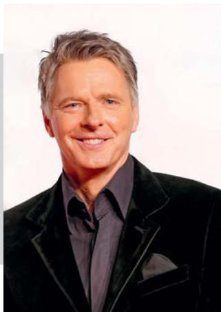
JÖRG PILAWA FERNSEHMODERATOR