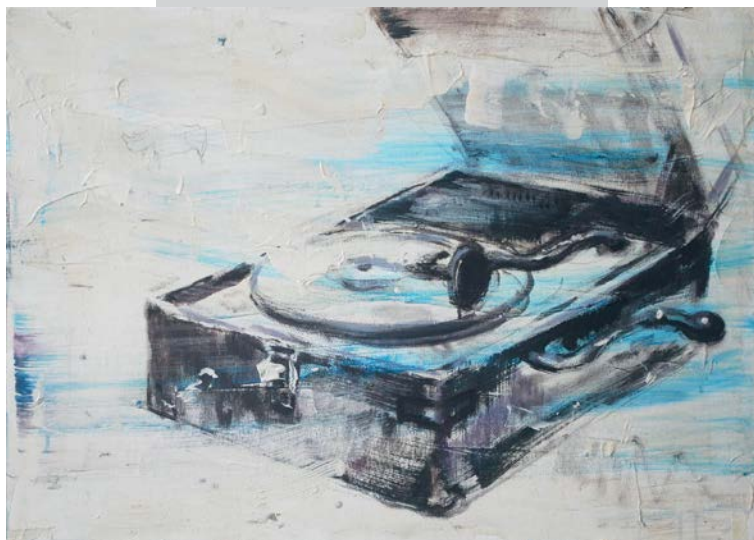
NELSON MÜLLER KOCH, GASTRONOM UND SÄNGER