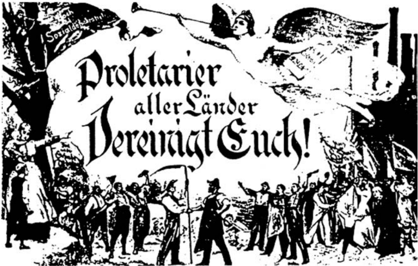
Flugblatt zum 1. Mai 1896

kerung. Auch wenn auf der politischen Ebene die Auseinandersetzungen um Nationalstaat, Parlamentarismus und monarchistische Restaurationsbestrebungen im Vordergrund stehen mögen, zeichnet sich vor allem bei den in der Mitte des Jahrhunderts erfolgenden Parteiengründungen (Konservative, Liberale und Sozialdemokratie) das wirtschaftlich geprägte Spektrum der Interessen von den Landjunkern/Großgrundbesitzern über die Unternehmer bzw. Akademiker bis zur Arbeiterschaft ab.