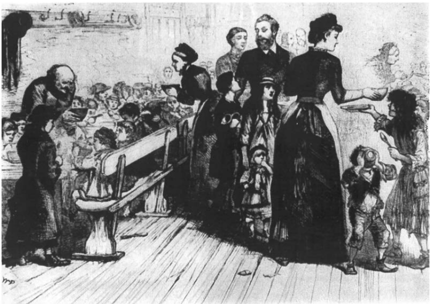
Speisung der Armen

Weil in diesem Pauperisierungsprozess des Kleinhandwerkers, der Landarbeiterin und des Tagelöhners die traditionellen Bindungen zerstört werden, entfaltet er eine neue, systemsprengende Qualität: Die Armut ist nicht mehr integrierter Bestandteil der ständischen Ordnung, sondern wird zu einer Anklage gegen die neue gesellschaftliche Ordnung. Die Einsicht in die veränderten Zusammenhänge des Elends beunruhigt das Bürgertum zutiefst. In den dreißiger und vierziger Jahren bürgert es sich ein, von der sozialen Frage zu sprechen. Es entsteht eine Fülle von Literatur zum Problem des Pauperismus und es gibt zahlreiche Vorschläge zur Lösung der sozialen Frage, aber auch praktische Versuche, durch Vereine, Unterstützungskassen, karitative und philanthropische Einrichtungen die soziale Not zu mildern. Einige Unternehmer richten selbst Kranken- und Altersversorgungskassen ein (zum Beispiel Krupp bereits im Jahre 1835), in der Regel sind es aber die Kirchen und die Gemeinden, deren Almosen bzw. deren Unterstützungspflicht gegenüber den Armen in Anspruch genommen wird.